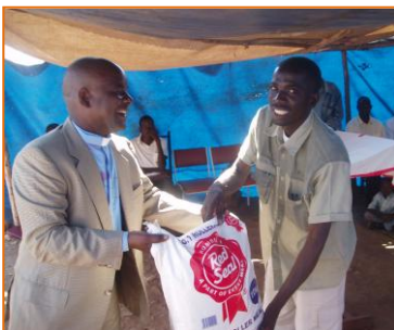
Ein kranker Minenarbeiter erhält einen Sack Mais