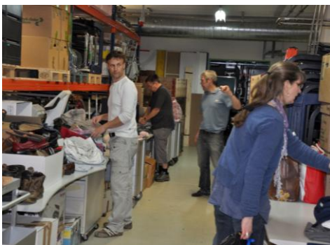
Beim Packen in der Lagerhalle