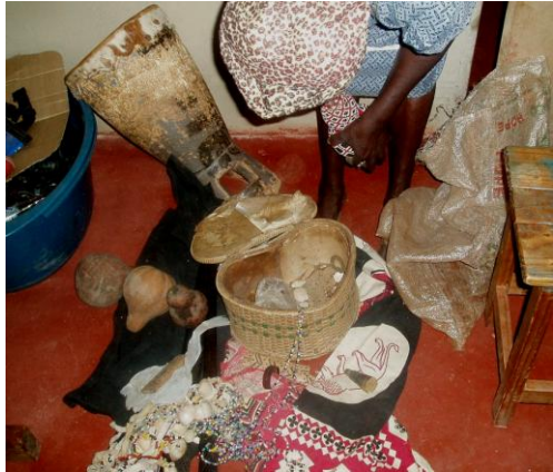
Gebrauchsgegenstände des Medizinmannes