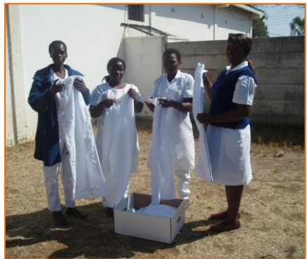
Krankenschwestern sind glücklich über die Berufskleider