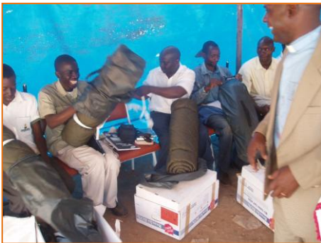
Grosse Dankbarkeit der Minenarbeiter für das wertvolle Geschenk eines Schlafsacks