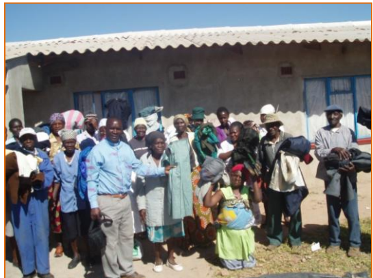
Alte Menschen und pensionierte Minenarbeiter in Rutendo werden mit Kleidern versorgt