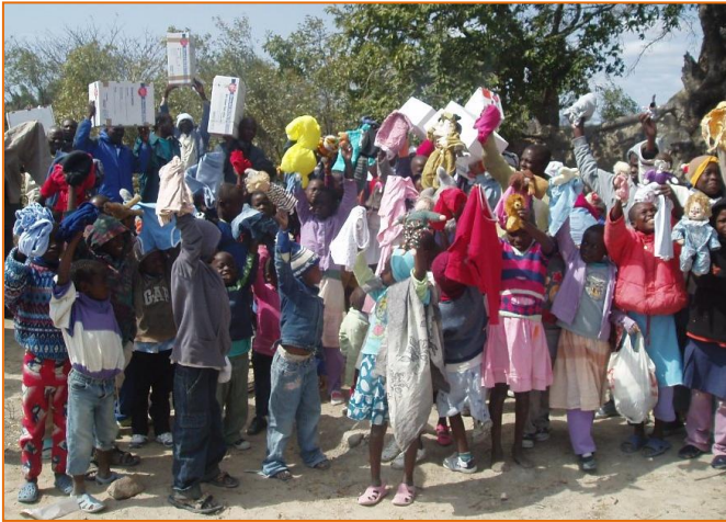
Sichtbare Freude bei den Menschen in Shurugwi über die empfangenen Kleider